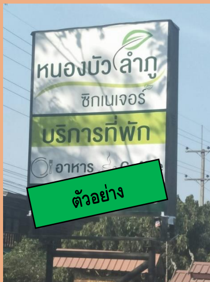
ตัวอย่างป้าย